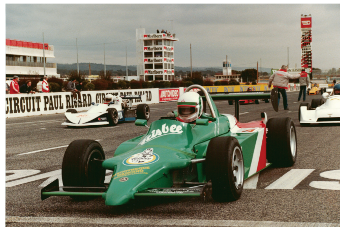
F3 Castellet 1986