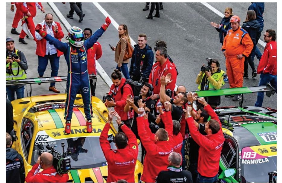
Ferrari Challenge 2018

J'espère bien ! J'ai encore des projets, et comme je l'ai toujours dit, «tant que je ne serai pas une chicane mobile et que le plaisir sera présent, je ne vois aucune raison de m'arrêter».