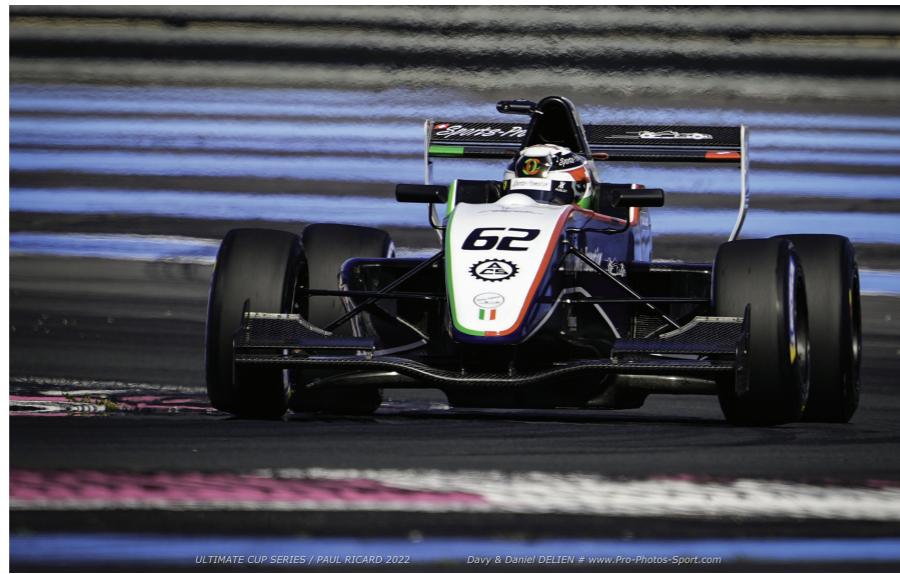
Formule Renault 2022