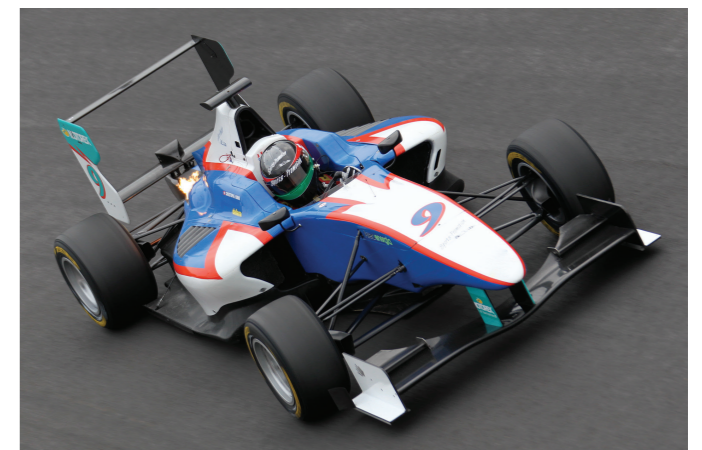
GP3 Monza 2011