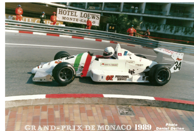
F3 Monaco 1989